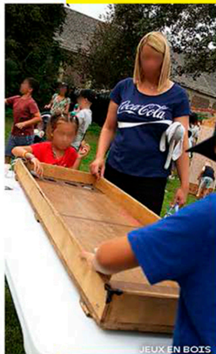
JEUX EN BOIS