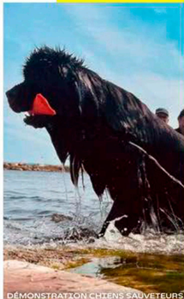
DÉMONSTRATION CHIENS SAUVETEURS

Visitez le terriil grâce à un guide de l'office de tourisme et sa formule express à 11h et 15h - Gratuit [Réservation obligatoire].